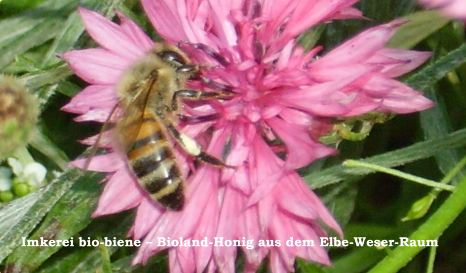
Imkerei bio-biene – Bioland-Honig aus dem Elbe-Weser-Raum